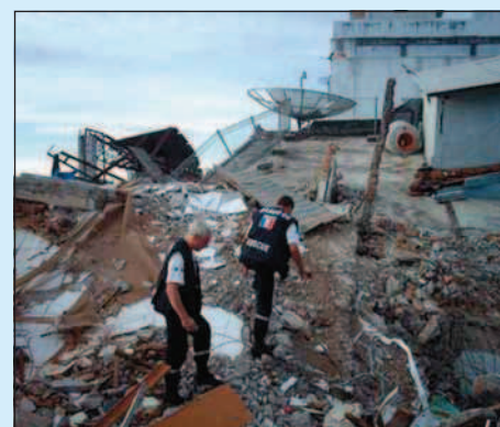
Beaucoup d'immeubles se sont totalement écroulés à Padang.